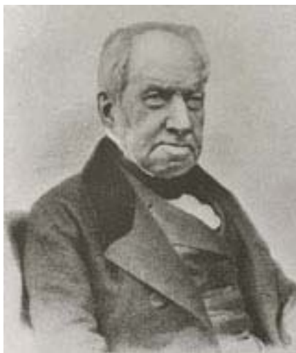
Роберт БРОУН Robert Brown, 1773–1858

Летом 1827 года Броун проводил исследования пыльцы растений. Он, в частности, интересовался, как пыльца участвует в процессе оплодотворения. Как-то он разглядывал под обычным микроскопом выделенные из клеток пыльцы североамериканского растения Clarkia pulchella (кларкии хорошенькой) взвешенные в воде удлинённые цитоплазматические зерна. Неожиданно Броун увидел, что мельчайшие твердые крупинки, которые едва можно было разглядеть в капле воды, непрерывно дрожат и передвигаются с места на место. Он установил, что эти движе-