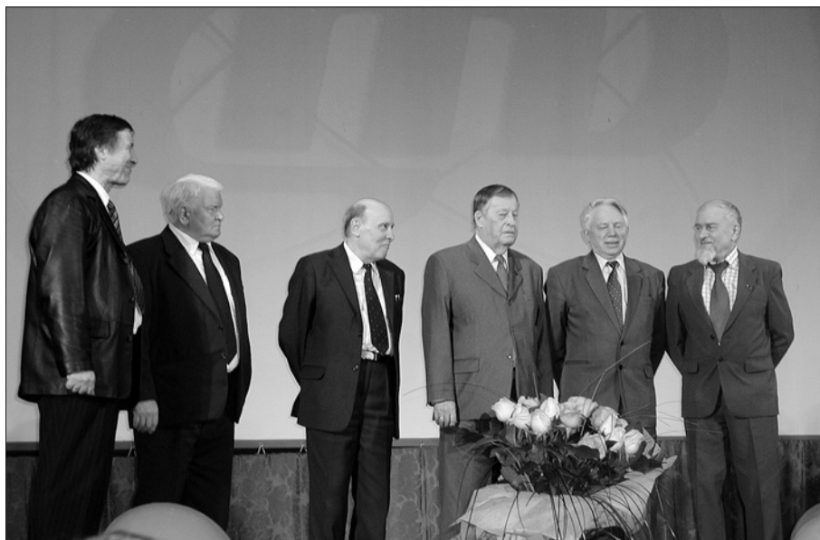
На сцене — деканы факультета разных лет.

Что касается интересов ИЯФ, я еще раз подчеркиваю, что это